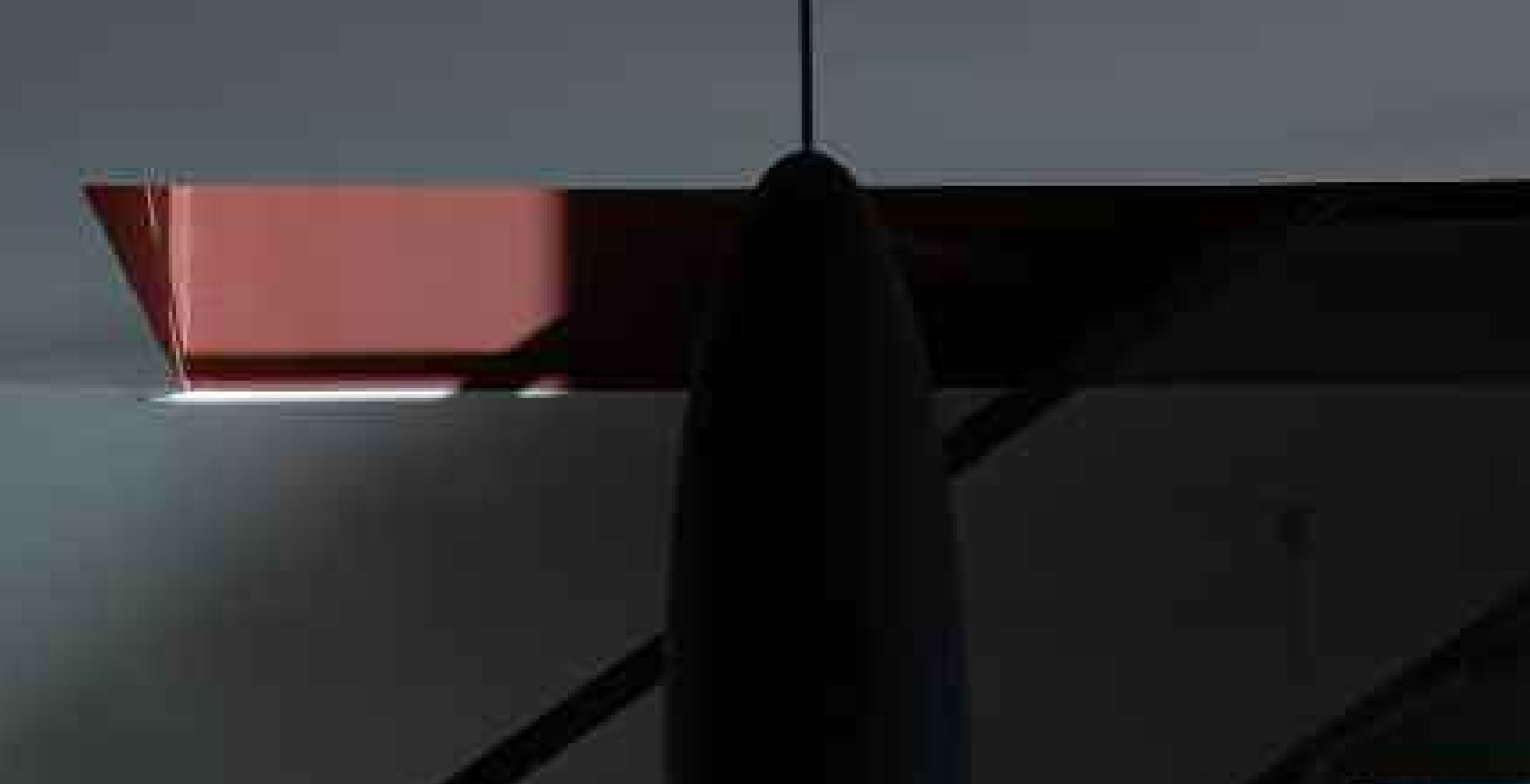
Graphisme d'une architecture de béton ciré Matières Marius Aurenti et de couleurs extramates kaki et rouge Morgon, La Seigneurie. Canapés en cuir blanc et