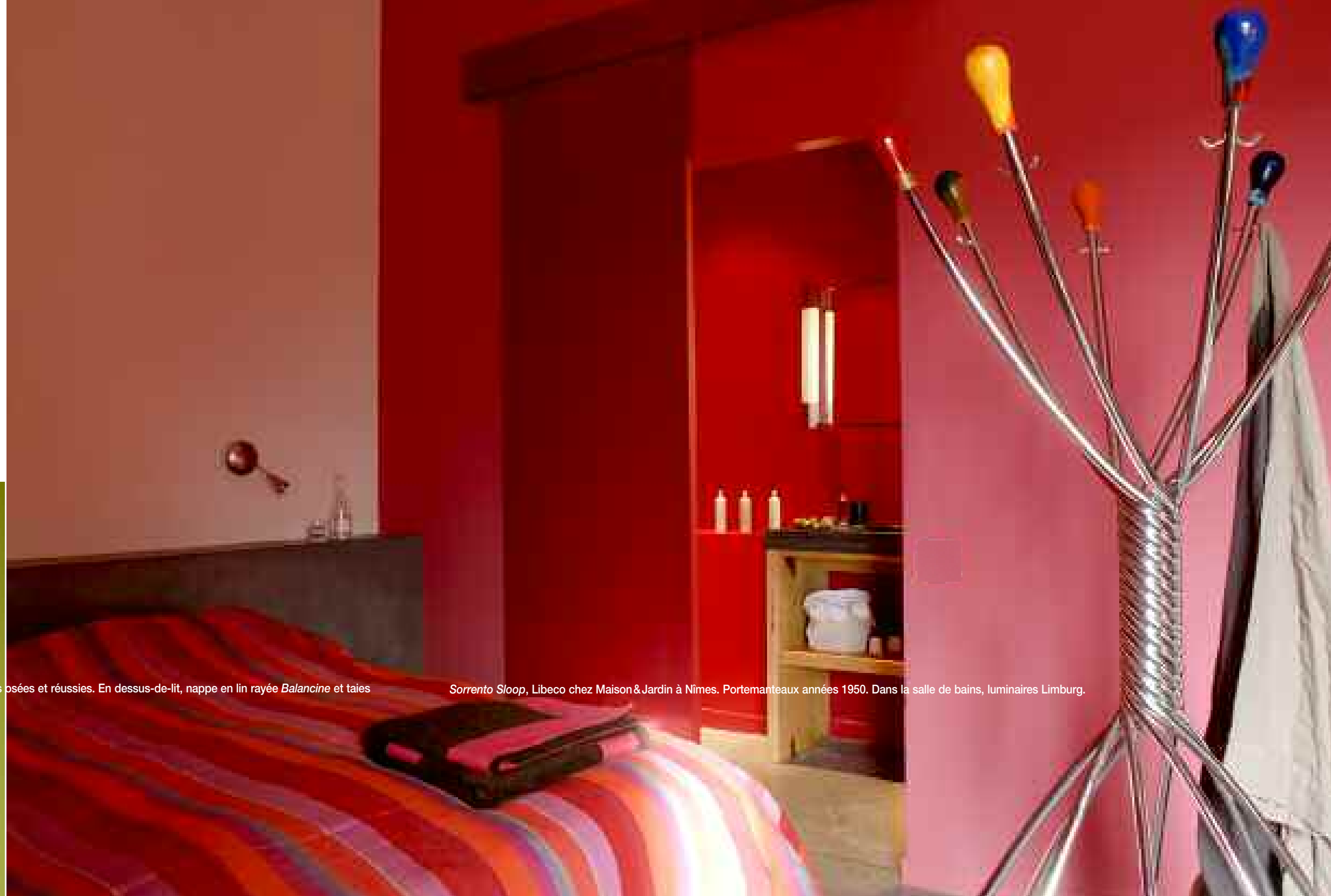
Portemanteaux années 1950. Dans la salle de bains, luminaires Limburg.