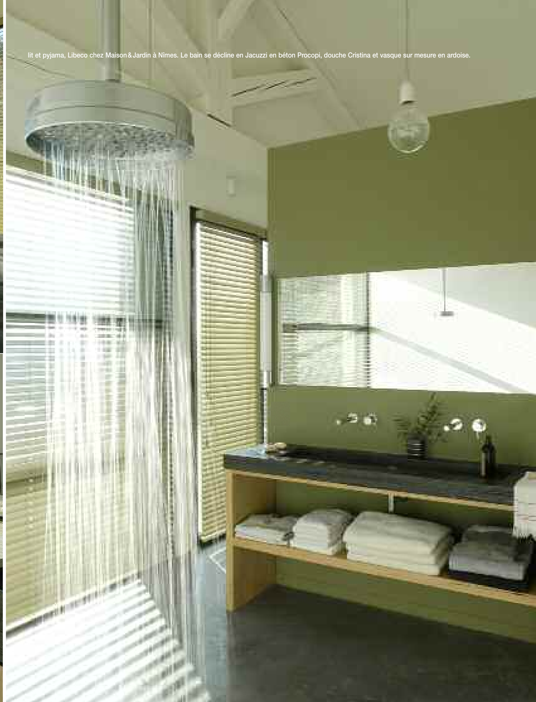
lit et pyjama, Libeco chez Maison & Jardin à Nîmes. Le bain se décline en Jacuzzi en béton Procopi, douche Cristina et vasque sur mesure en ardoise.