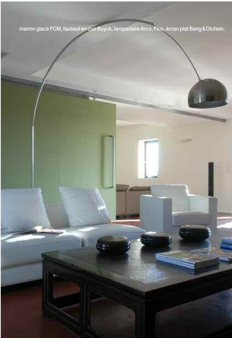
marron glacé FCM, fauteuil en cuir Buyck, lampadaire Arco, Flos, écran plat Bang & Olufsen.