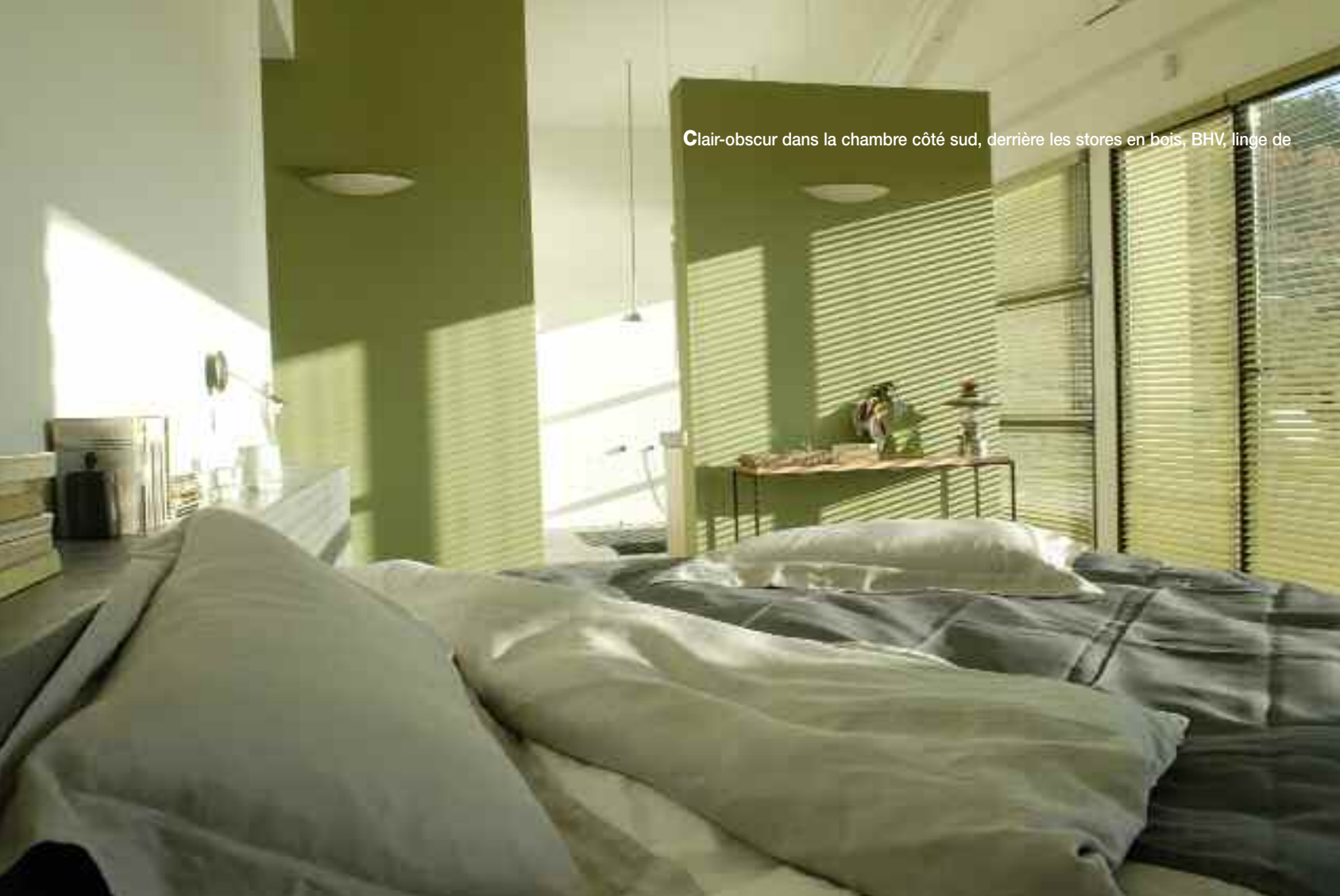
Clair-obscur dans la chambre côté sud, derrière les stores en bois, BHV, linge de